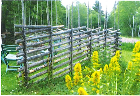
Gärdesgård som sattes upp för ett antal år sedan vid inre gården.