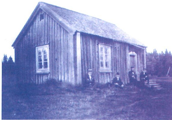
Gammalt foto på Båtsmanstorpet